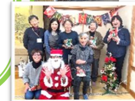
12月のクリスマス会、楽しかったね。(田之口区「ほがらか会」)

しかし地域全体の高齢化がより深刻となり活動できる人に苦勞する状態となっています。今後のコミュニティ維持に不安な状況ですが今後とも皆様のご協力をお願い致します。