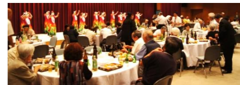
7月14日荷頃地区敬老会を開催

旧荷頃村の北荷頃、一之貝、軽井沢、比礼、本津川の5集落では、地区区長会と連携して地域活動を展開しています。7月には5年ぶりに地区敬老会を開催。生花、民踊、俳句、お茶、フラダンス教室の活動は第2回北荷頃区民文化祭で披露しました。こうした活動の中で地域で暮らす人の心の交流は深まっています。