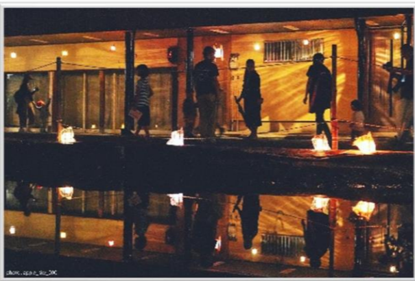
※例年の「トチオノアカリ」の様子。

栃尾地域親善ゴルフ大会実行委員会 事務局 (三条コース内) ☎0256-46-4883