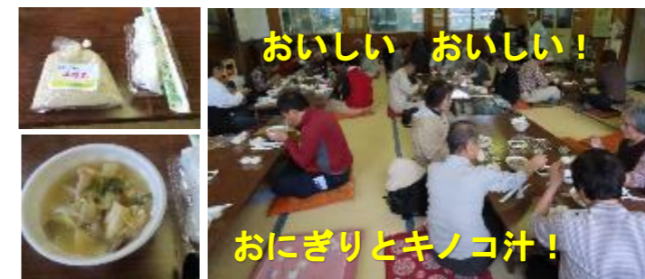
おいしい おいしい!