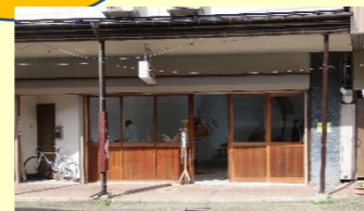
通りから見た白昼堂堂

日常生活の中から、「いきなり美術館」の白昼堂堂。町の中身の身近なギャラリーの今後に皆さんもご注目ください。そして、何時でもぶらりと立ち寄っていただきたいと思います。