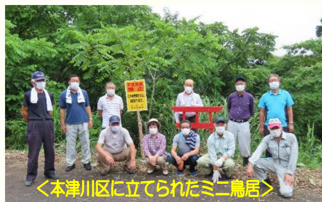
<本津川区に立てられたミニ鳥居>