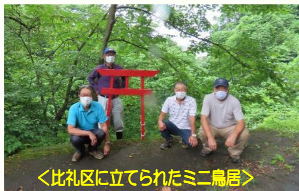
<比礼区に立てられたミニ鳥居>

本津川区と比礼区に新しく4基設置されました。 栃尾地域に設置された赤いミニ鳥居は、43基になりました！