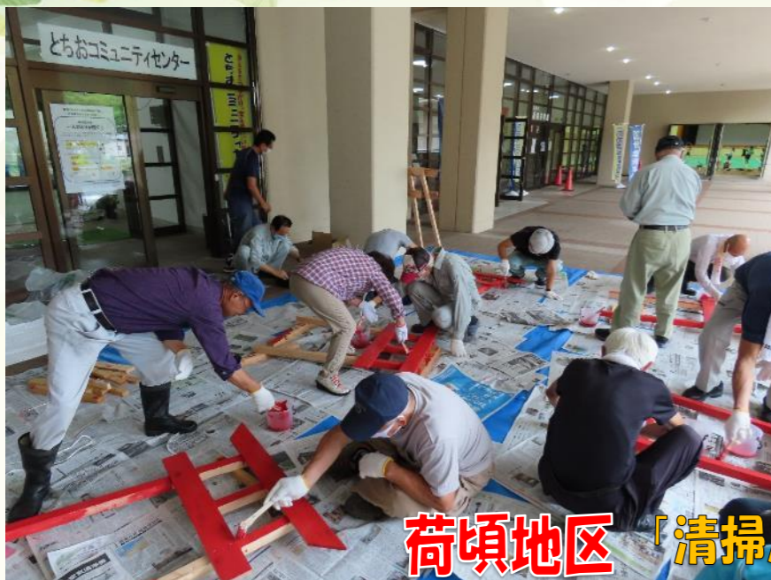
荷頃地区「清掃及び環境美化啓発活動」