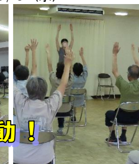
しっかり学んで、優しく楽しく運動!

フレイル予防のための栄養、骨を丈夫にする運動や食事、脳の5つの機能の測定と活性化する運動などを内容とし、7月から4つの講座を開催しました。バラエティに富んだ内容で好評のシリーズも残すところ4回となりました。