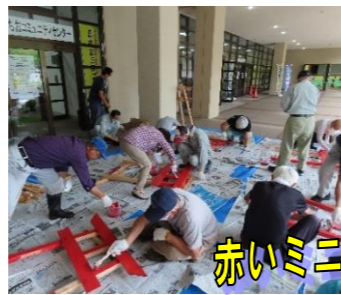
赤いミニ鳥居作製と設置