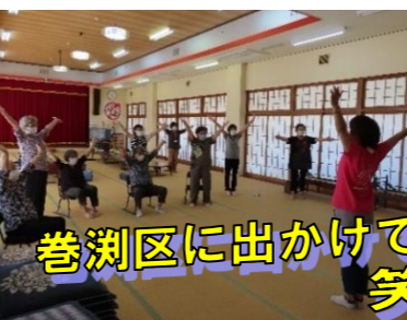
巻洲区に出かけて! 笑いヨガ!

巻洲区「よらん会」7/14(水) 皆楽荘 金町区「はなの会」7/21(水) 栃尾文化センター