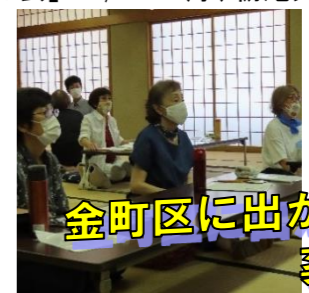
金町区に出かけて! 薬の話!