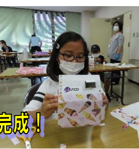
電気について楽しく学んで、オリジナルソーラーハウス完成!

スライドで「電気の作り方・送り方・使われ方」を学習した後、ソーラーメロディハウスキットを組み立てました。色を塗ったり、キラキラシールや折り紙を貼ったりして自分だけのオリジナル作品を完成させました!