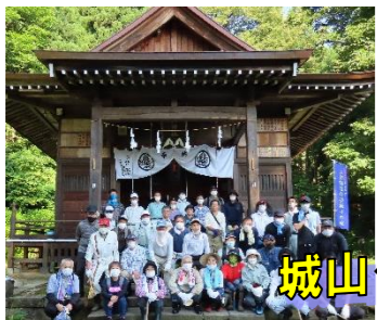
城山クリーン作戦