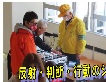
反射・判断・行動のシミュレーター体験