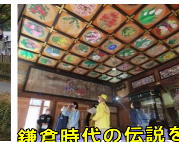
鎌倉時代の伝説を残す羽黒神社