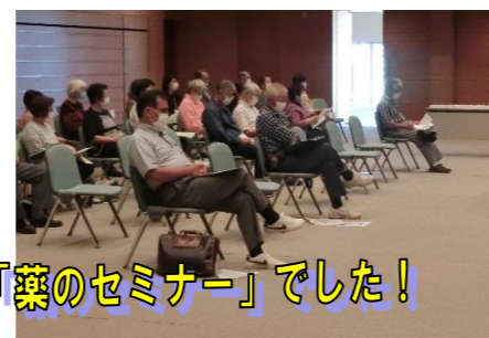
まちキャン長岡栃尾分校がおくる第1回文化講演は「薬のセミナー」でした!

文化講演活動の今年度1回目は、何回聞いても役にたち、一年に1回は聞いておきたい薬の話「薬のセミナー」でした。薬事衛生指導員の講師から、薬の正しい使い方や飲み方、副作用などについて話を聞きました。