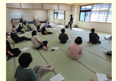
自分だけで運動するのは難しいですが、仲間と一緒に楽しく続けられます。あなたも地域の介護予防サークルに参加しませんか?

秋からは以下の講座を予定しています。初めての受講大歓迎! 「今できること」みつけませんか。