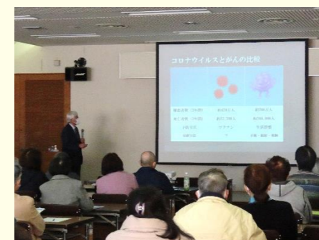
専門講師による、健康でためになる情報満載の楽しい講座。(昨年度の様子)