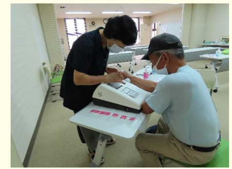
健康づくりはコツコツと・・・。 骨の健康度を測定します。(昨年度の様子)