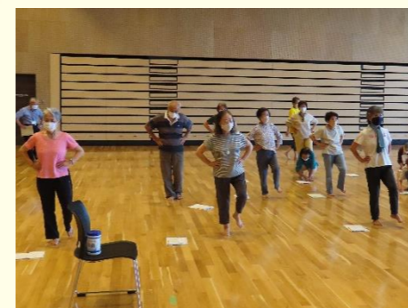
感染対策をしながら運動実践中! みんなで楽しく健康づくり!

とちおコミセンと栃尾支所市民生活課がタッグを組み、栃尾地域住民の健康増進のため、栄養・運動・こころなどの講座を毎月開催しています。健診で異常がなかった人も健康寿命を延ばすために、できることから始めませんか。