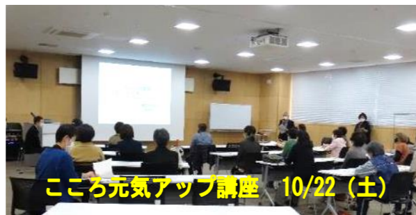
こころ元気アップ講座 10/22 (土)

1年間を通して、ほぼ毎月「健康づくり講座 2022」を開催。健康な体と心で毎日の生活を送るための体操や血圧測定、豊富な資料を使ったの講義など、健康・福祉・児童部会は健康的な毎日にするための事業を進めています。皆さんの住む地区に出かけての「出前！健康講座」もあります！