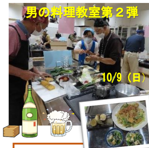
男の料理教室第2弾