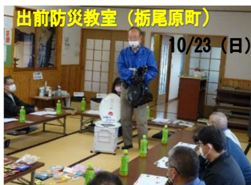
出前防災教室 (栃尾原町)