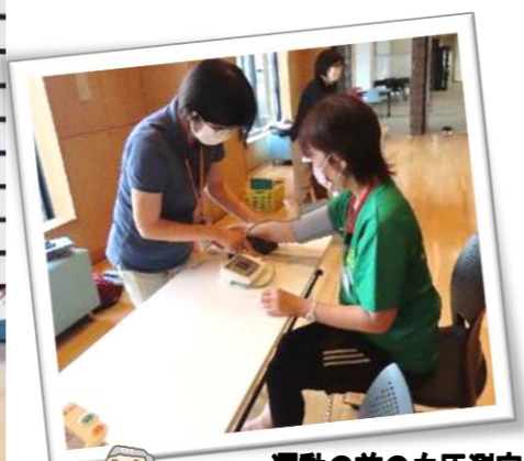
運動の前の血圧測定