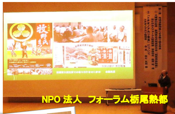
NPO 法人 フォーラム栃尾熱都

地元で活動に取り組む人や団体、区長さん、地域住民が集まり みんなで 栃尾の今とこれから について考えました