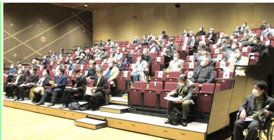
第1部 地域活動団体による取り組み発表

第1部では、栃尾を盛り上げるための取り組みを進め、残念ながらも、来年は、皆様もぜひご参加ください。みんなで集まり、これからの栃尾について楽しく語り合いました。な、とちおコミセンは12/28(土)~1/4(水)まではお休みです。それでは、よいお年をお迎えください！