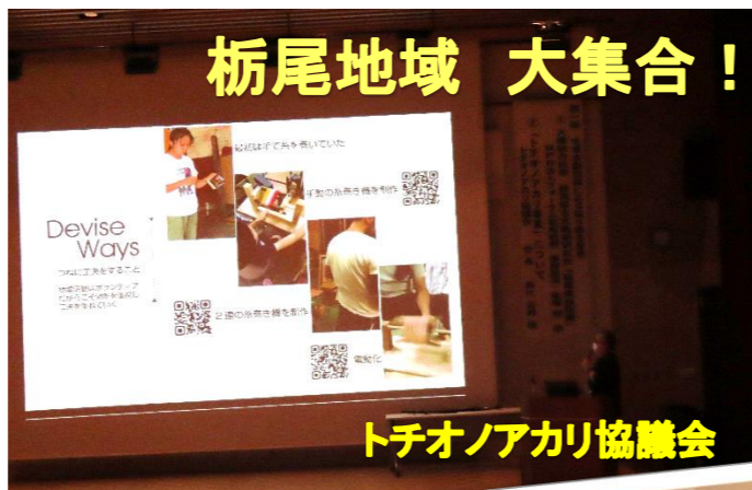
トチオノアカリ協議会