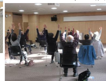
<脳トレ運動講座> 12/13(火)

脳の5つの機能を測定して、脳の健康度をチェック！測定した結果をお返しし、脳を使う生活について話を聞き、脳を活性化する運動を実践しました。