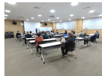
<脳の健康度測定> 11/29(火)