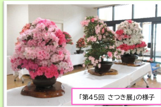
「第45回 さつき展」の様子

春の盆栽展(3月)、さつき展(6月)、秋の文化祭出展(11月)、年末年史の展示(信金ギャラリー)の年4回程度、出展活動しています。