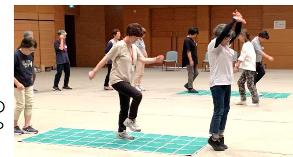
【歩くだけで脳トレ教室】

全5回で実施された脳トレ教室は、転倒骨折や認知症機能低下の予防に効果が期待されるスクエアステップを行いました。実際にやってみると「やみつき」になりそうな面白い運動です。 【9月4日(水)、11日(水)、18日(水)、25日(水)、10月2日(水)】