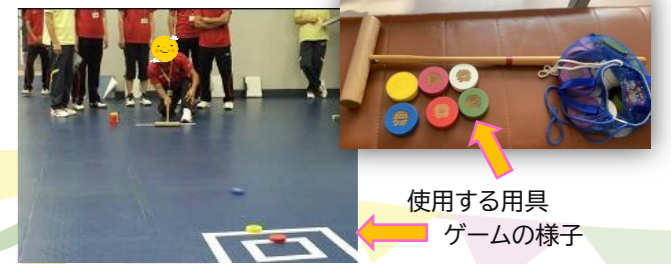
使用する用具 ゲームの様子

申込み 11月29日(金)まで とちおコミセンへ ※小学1年生くらいから楽しめる内容です。 TEL 89-7305 FAX 94-5210 (火曜日から土曜日の 9:00~16:00)