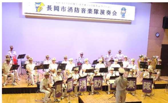
【長岡市消防音楽隊演奏会】