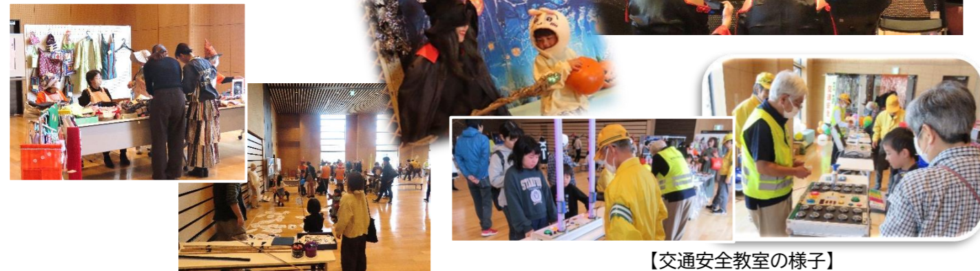
【交通安全教室の様子】